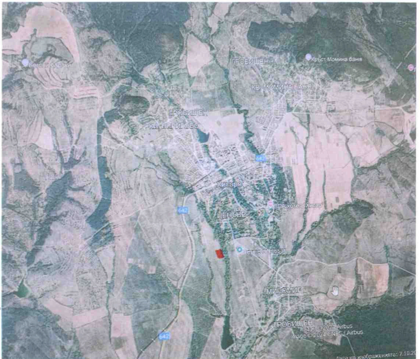
Фигура 2. Местоположение на територията, предвидена за промяна и най-близките до нея елементи на НЕМ

6. Нормативни изисквания за провеждане на наблюдение и контрол по време на прилагане на плана или програмата, в т.ч. предложение на мерки за наблюдение и контрол по отношение на околната среда и човешкото здраве: