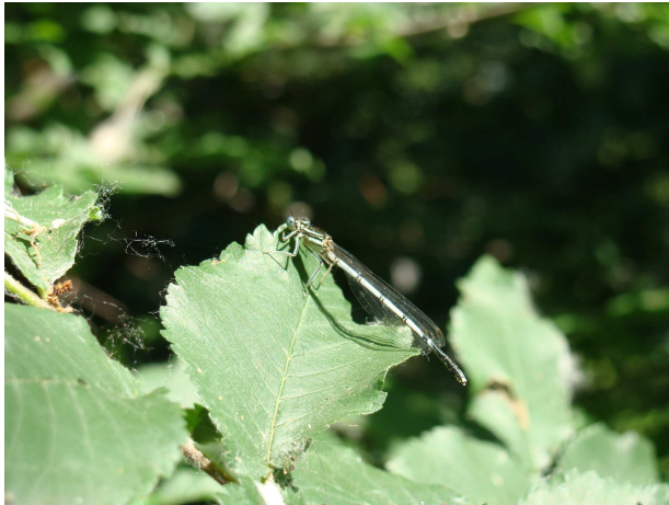
характерни за района растителни и животиски видове