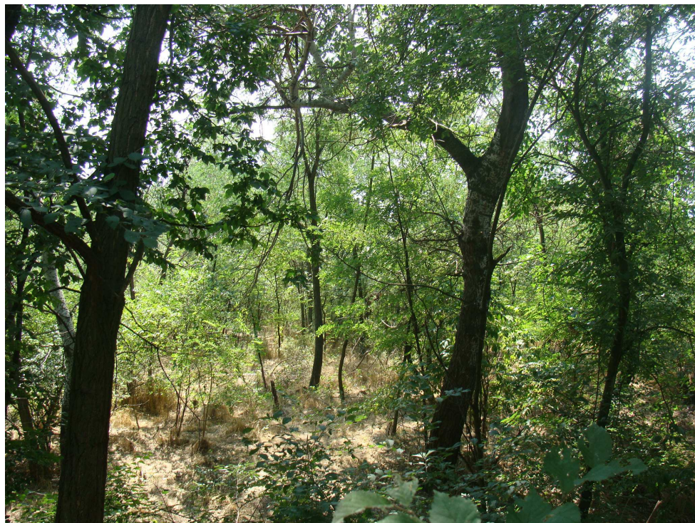
В обхвата на втория гребен канал новоразвиващата се дървесна и храстова е доминирана от култивари и инвазивни видове