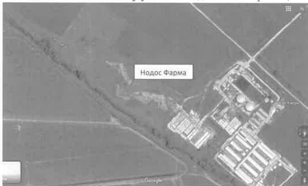
Фигура 1. Извадка от Гугъл сателитна карта с означено местоположение на имота, предмет на инвестиционното предложение, и съседни имоти

Имотът е с неправилна форма. На югозапад граничи с р. Потока, на североизток с полски път, на югоизток с биогаз инсталацията и с парцел, в който се намира свинефермата за майки. На югоизток от биогаз инсталацията и свинефермата за майки е изградена и въведена в експлоатация ферма за отглеждане на 2000 броя овце.