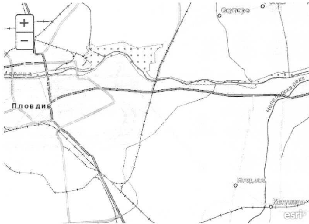
„Река Чая” код BG0000194 . Защитена зона по Директива 92/43/ЕЕС за опазване на природните местообитания и на дивата флора и фауна