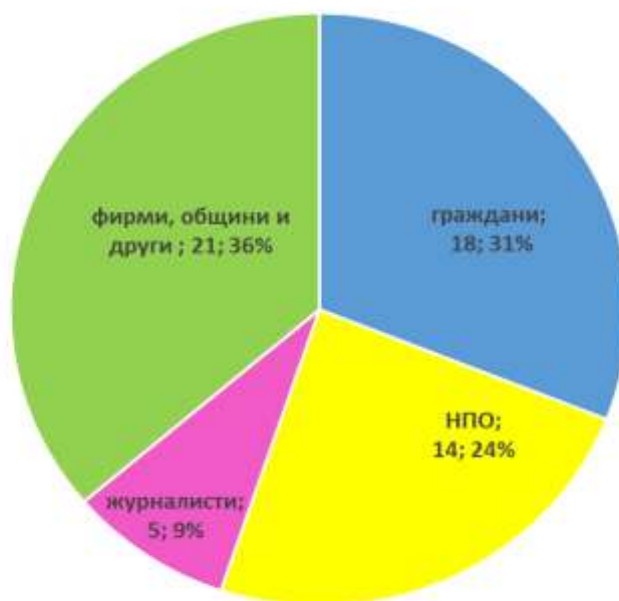
Фиг. 1 Постъпили заявления по ЗДОИ в РИОСВ-Пловдив през 2024 г. по тип на заявителя

През 2024 г. в РИОСВ – Пловдив са постъпили 58 заявления за достъп до информация. Анализът на профила на търсещите информация сочи, че 18 от заявителите са граждани (31 %), 5 са журналисти (9 %), 14 (24 %) – представители на неправителствени организации (НПО) и 21 (36 %) - друг тип, като това включва търговски дружества, общински и държавни администрации.