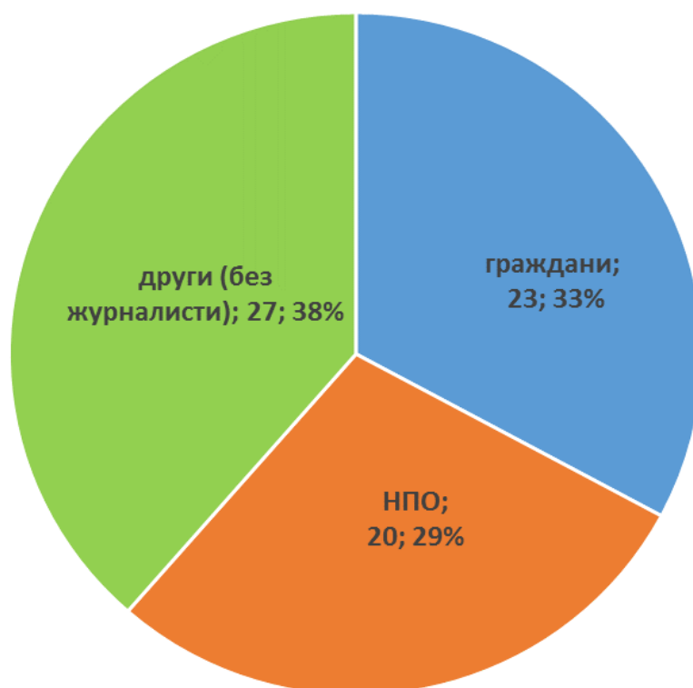
Фиг. 1 Постъпили заявления по ЗДОИ в РИОСВ-Пловдив през 2023 г. по тип на заявителя

За отчетния период най-много заявления са получени чрез електронна поща или чрез системата за електронен обмен – 54 на брой (67%). Шест от заявленията са входираны на място в деловодството на РИОСВ – Пловдив, шест са получени по пощата, а останалите 4 – чрез Платформата за достъп до обществена информация, поддържана от Министерски съвет. Няма регистрирани устни запитвания. Исканата информация е предоставяна по електронен път винаги, когато това е поискано от заявителя и/или когато заявлението е постъпило по електронен път (съгл. чл. 41е, ал. 2 от ЗДОИ).