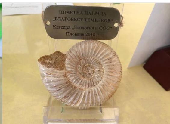
Почетна награда „Благовест Темелков“, връчена на „Екологията - начин на мислене“ 10 (01.11.2018 г.).