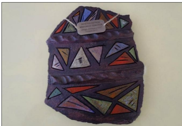
Първата почетна награда „Благовест Темелков“, връчена на „Екологията - начин на мислене“ 4 (11.05.2012 г.).